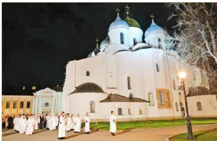
Ночные пасхальные богослужения пройдут в 72 храмах Новгородской области.

Губернатор поручил главам муниципалитетов взять ситуацию на личный контроль, а также особое внимание уделить состоянию кладбищ – не только в преддверии Пасхи, но и после. Организовать своевременный вывоз мусора, уборку территорий и содержание всех подходов и подъездов.