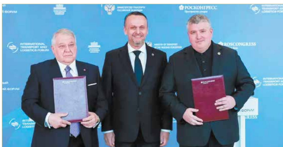
Новгородская область не первый год сотрудничает с Курчатовским институтом.