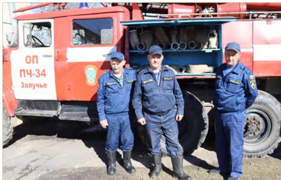
Всегда готовы выехать на вызов водитель, боец и начальник поста.

Распоряжением правительства Новгородской области от 27.03.2026 № 244-рг «О подготовке к пожароопасному сезону 2026 года» на территории области, за исключением земель лесного фонда, расположенных на территории Новгородской области, с 6 апреля 2026 года установлено начало пожароопасного сезона.