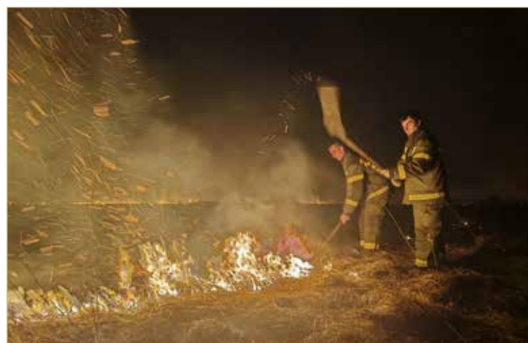
Там, куда техника проехать не может, в ход идут специальные приспособления, похожие на большие мухобойки.