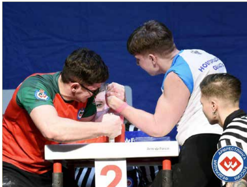
Армрестлеры встречаются лицом к лицу, и сломать настрой противника на борьбу можно одним взглядом ещё до старта поединка.