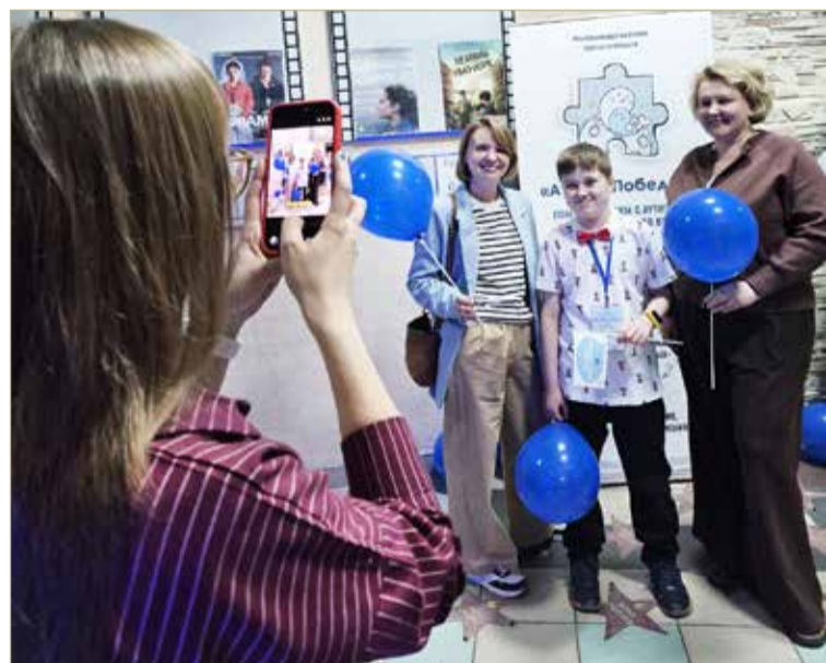
Организация «АутизмПобедим» пригласила на показ фильма своих друзей и партнёров.

— Для нашей организации важно, чтобы каждый знал пять мифов об аутизме. Первое, аутизм — не болезнь. Им нельзя заразиться или заболеть, он развивается до рождения ребёнка и не появляется от прививок и гаджетов. Второе, малыш с аутизмом может родиться в любой семье. Вне зависимости от уровня образования родителей, достатка и образа жизни семьи. Третье, аутизм — самое распространённое расстройство в мире. Четвёртое, люди с аутизмом очень разные. Пятое, они хотят общаться. Но не всегда знают, как это делать, испы-