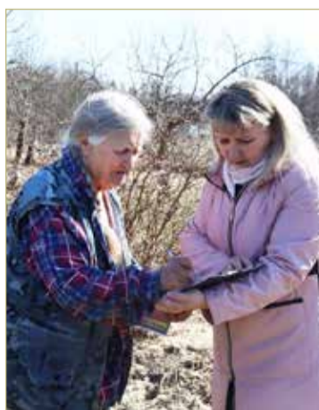
Информирование населения — важная часть противопожарной работы.