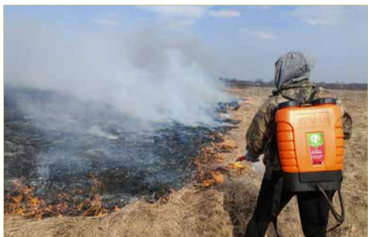
Бывает, что тушить палы около деревни выходят сотрудники функционального отдела, надев ранец «Ермак».