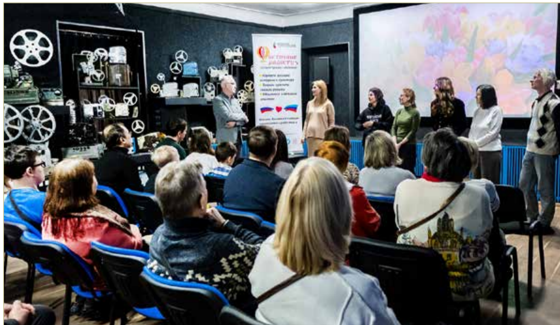
На премьере документального фильма «Ростки» в новгородском Киномузее.

И значит, мы ещё услышим что-нибудь вроде стартовой реплики в фильме «Ростки»: «Так, на часах девять, едем на первое мероприятие».